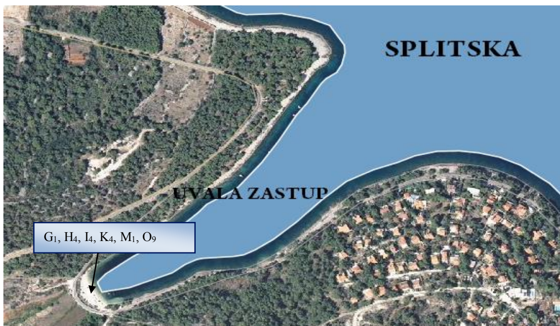
Slika 4. Pomorsko dobro obuhvaćeno ovim Planom na području naselja Splitska