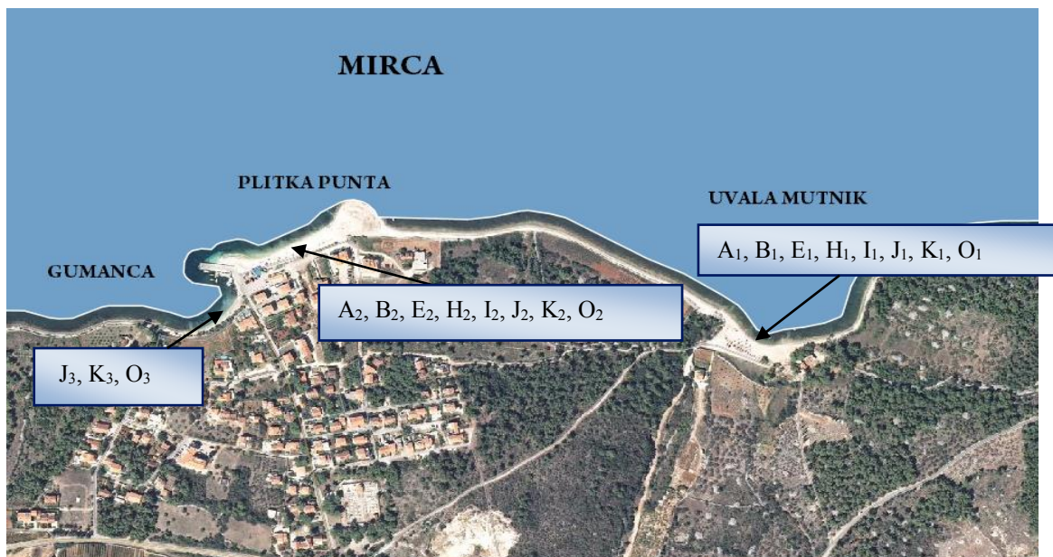
Slika 1. Pomorsko dobro obuhvaćeno ovim Planom na području naselja Mirca